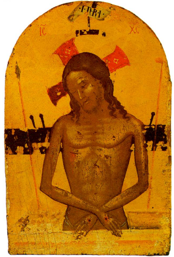
Ἱ. Εἰκὼν (ΙΕ΄ αἰ.), Ἱ. Μ. Ἀγίων Θεοδώρων Κερκύρας.

Ἴδου ὁ Νυμφίος ἔρχεται ἐν τῷ μέσῳ τῆς νυκτός· καὶ μακάριος ὁ δοῦλος, ὃν εὐρήσει γρηγοροῦντα· ἀνάξιος δὲ πάλιν, ὃν εὐρήσει ῥαθυμοῦντα. Βλέπε οὖν, ψυχὴ μου, μὴ τῷ ὕπνῳ κατενεχθῆς, ἵνα μὴ τῷ θανάτῳ παραδοθῆς, καὶ τῆς βασιλείας ἔξω κλεισθῆς· ἀλλὰ ἀνάνηψον κράζουσα· Ἄγιος, Ἄγιος, Ἄγιος εἶ ὁ Θεὸς ἡμῶν· διὰ τῆς Θεοτόκου ἐλέησον ἡμᾶς.