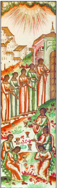
Μικρογραφία (1693), κῶδ. BAN Αρχ. κομ. 379, φ. 591β.

εἰσέλθω ἐν αὐτῷ· λαμπρυνόν μου τὴν στολὴν τῆς ψυχῆς, Φωτοδότα, καὶ σῶσόν με.