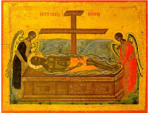
Ἱ. Εἰκὼν (ΙΗ' αἰ.), Ἱ. Σκῆπη Ἁγίας Ἄννης Ἀθωνος.

Τῇ ἐπαύριον μετὰ τὴν Παρασκευὴν, ἡμέρα Σαββάτου, Μαρτίου κδ', συναχθέντες οἱ ἀρχιερεῖς καὶ οἱ φαρισαῖοι πρὸς τὸν Πιλάτον παρεκάλεσαν αὐτὸν ἵνα ἀσφαλίσῃ τὸν τάφον τοῦ Ἰησοῦ ἕως τῆς τρίτης ἡμέρας διότι, καθὼς ἔλεγον οἱ θεομάχοι, ἔχομεν ὑποψίαν μήπως οἱ μαθηταὶ Αὐτοῦ, κλέψαντες διὰ νυκτὸς τὸ ἐνταφιασθὲν Αὐτοῦ σῶμα, κηρύξωσιν ἔπειτα εἰς τὸν λαὸν ὡς ἀληθινὴν τὴν ἀνάστασιν, ἣν προεῖπεν ὁ πλάνος ἐκεῖνος, ἔτι ζῶν· καὶ τότε ἔσται ἡ ἐσχάτη πλάνη χεῖρων τῆς πρώτης. Ταῦτα εἰπόντες πρὸς τὸν Πιλάτον καὶ λαβόντες ἄδειαν παρ' αὐτοῦ, ἀπῆλθον καὶ ἐσφράγισαν τὸν τάφον, διορίσαντες πρὸς ἀσφάλειαν αὐτοῦ καὶ κουστωδίαν, τοὔτεστι φύλακας ἐκ τῶν φυλασσόντων τὴν πόλιν στρατιωτῶν.