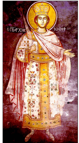
Τοιχογραφία (1779), Καθολικὸν Ἱ. Μ. Γρηγορίου Ἀθωνος.

Τὴν συναγωγὴν, συκὴν Χριστός, Ἑβραίων, Καρπῶν ἄμοιρον πνευματικῶν εἰκάζων, Ἀρᾷ ξηραίνει ἧς φύγωμεν τὸ πάθος.