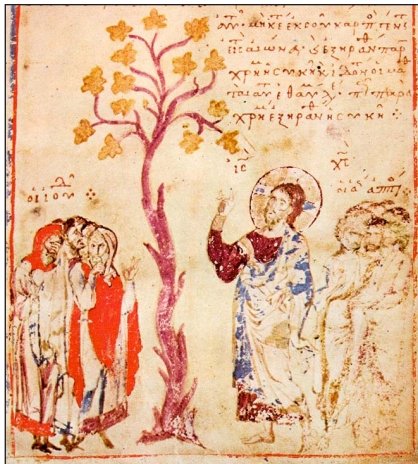
Μικρογραφία (περὶ 1313), κῶδ. 65, φ. 5α, Ἱ. Μ. Διονυσίου Ἀθωνοῦ.