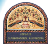
Κατηχητὰ Ἐνοριακοῦ Κέντρου Ἱ. Μ. Ἀγ. Κυπριανοῦ καὶ Ἰουστίνης Φυλῆς «Τὰ Παιδιὰ τῆς Παναγίας»