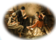
Μελέματα ἀπὸ τὴν Πολιτιστικὴν Παράδοση τῆς Ρωμανίας