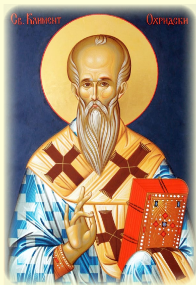
Ὁ Ἅγιος Κλήμης, Ἐπίσκοπος Ἀχρίδος καὶ Βουλγαροκέρυξ ἐπονομαζόμενος