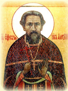
Ὁ Ἅγιος Νέος Ἱερο- μάρτυς Ἀλέξιος (Μπε- νεμάνσκυ) ἐν Τβέρ