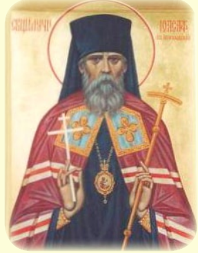
Ὁ Ἅγιος Νέος Ἱερομάρ- τυς Ἰωάσαφ (Ζεβάχωβ), Ἐπίσκοπος Μόγκιλεφ