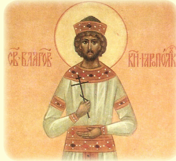
Ὁ Ἅγιος Πέτρος Γιαροπόλκ, Ἡγεμὼν τοῦ Βλαδιμίρ (Ρωσία)