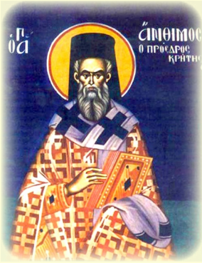
Ὁ Ἅγιος Ἄνθιμος Ἀρχιεπίσκοπος Κρήτης, ὁ Ὁμολογητής