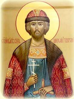
Ὁ Ἅγιος Μάρτυς Μιχαήλ, Ἡγεμὼν τοῦ Τβέρ