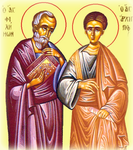
Οἱ Ἅγιοι Ἀπόστολοι Φιλήμων Ἐπίσκοπος Γάζης καὶ Ἀρχιππος, ἐκ τῶν Ο΄