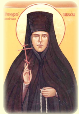
Ἡ Ἅγία Νέα Ὁσιομάρ- τυς Παρασκευή (Ματι- γιέσινα), ἡ ἐν Ρωσία