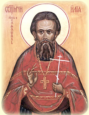
Ὁ Ἅγιος Νέος Ἱερομάρτυς Ἡλίας (Γκρομογκλασόβ) ἐν Τβέρ