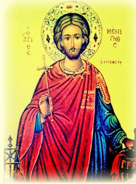
Ὁ Ἅγιος Μάρτυς Μένιγνος, ὁ κναφεὺς