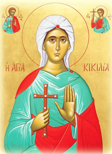
Οἱ Ἅγιοι Μάρτυρες Κικιλία, Βαλεριανὸς (ἀριστερὰ) καὶ Τιβούρτιος (δεξιὰ, βλ. ἐδῶ )