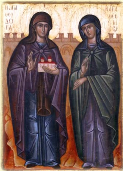
Ἡ Ὁσία Θεοδώρα ἡ ἐξ Αἰγίνης καὶ ἐν Θεσσαλονίκη ἀσκήσασα καὶ ἡ θυγα- τηρ αὐτῆς Ὁσία Θεοπίστη