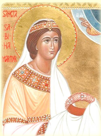
Ἡ Ἁγία Μάρτυς Σαβίνα, ἡ ἐν Ῥώμῃ