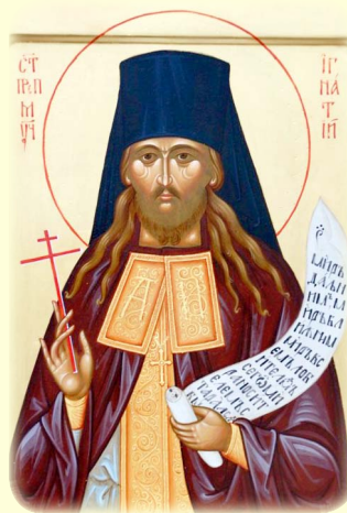
Ὁ Ἅγιος Νέος Ἱερο- μάρτυς Ἰγνάτιος (Λέμπεδεβ), ὁ ἐν Ῥωσία