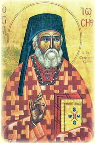
Κατάθεσις τοῦ τιμίου Λειψάνου τοῦ Ὁσίου Ἰωσήφ τοῦ Ἁγιασμένου τοῦ Σαμακοῦ