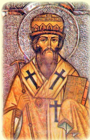
Ὁ Ἅγιος Τύχων τοῦ Ζαντόσκ, Ἐπίσκο- πος Βορονέζ (Ρωσία)