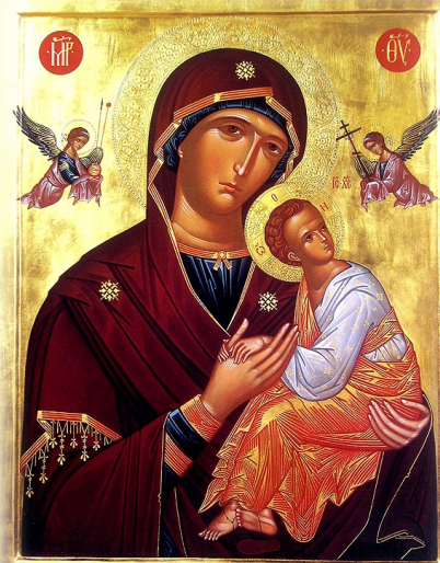
Σύναξις τῆς Ἱερᾶς Εἰκόνος τῆς Ἵπεραγίας Θεοτόκου τῆς ἐπονομαζομένης «Παναγία τῶν Θείων Παθῶν»