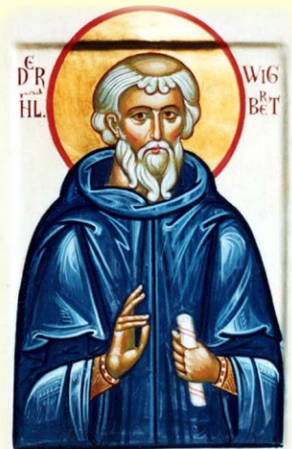
Ὁ Ὁσιος Οὐίγβέρτος ἐξ Ἀγγλίας, Ἡγούμενος καὶ Ἱεραπόστολος ἐν Γερμανίᾳ