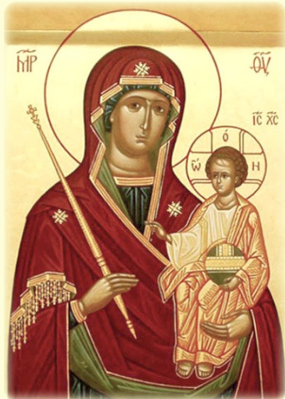
Σύναξις τῆς Ἱερᾶς Εἰκόνος τῆς Ἵπεραγίας Θεοτόκου τῆς ἐπονομαζομένης «Παναγία τοῦ Μίνσκ»