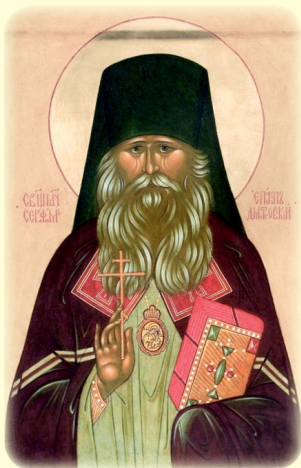
Ὁ Ἅγιος Νέος Ἱερο- μάρτυς Σεραφεῖμ (Ζβεζδίνσκυ), Ἐπίσκο- πος Δημητρώβ (Ρωσία)