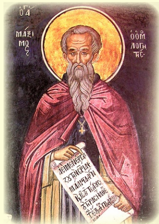
Ἀνακομιδὴ καὶ μετᾱθε- σις τῶν τιμίων Λειψά- νων τοῦ Ἁγίου Μαξιμου τοῦ Ὁμολογητοῦ (βλ. ἐδῶ)