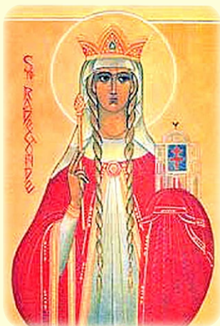
Ἡ Ὁσία Ραδεγοντία, Βασίλισσα τῶν Φράγκων. (βλ. ἐδῶ)