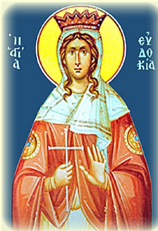
Ἡ Ἁγία Εὐδοκία, ἡ Βασίλισσα