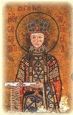
Ἡ Ἁγία Εἰρήνη ἡ Βασι- λισσα, ἡ διὰ τοῦ Ἀγγελι- κοῦ Σχιμάτος μετονομα- σθεῖσα Ζένη Μοναχῆ (βλ. ἐδῶ)