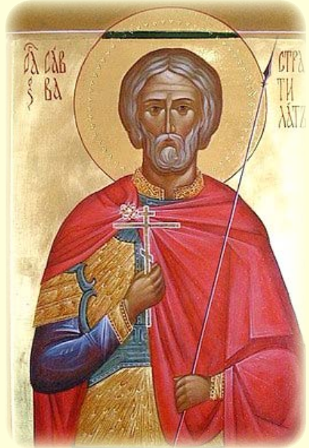
Ὁ Ἅγιος Μάρτυρ Σάββας ὁ Στρατηλάτης, ὁ Γότθος, ἐν Ρώμῃ