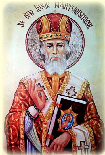
Ό Άγιος Ιωσήφ ό Όμολογητής, Επίσκοπος Μαραμουρες (1690-1711)