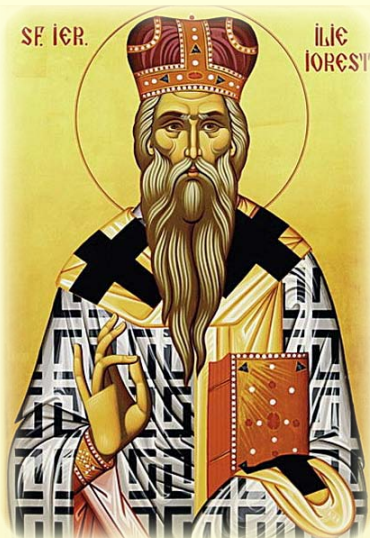
Ό Άγιος Ιορέστ-Ηλίας ό Όμολογητής, Μητροπολίτης Άλμπα -Ιουλίας και Τρανσυλβανίας (1640-1643)