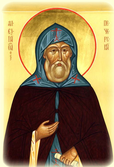
Ὁ Ὁσιος Ἀλέξιος, ὁ Ἐγκλειστος ἐν τῇ Ἱ. Λ. τῶν Σηλαιῶν τοῦ Κιέβου