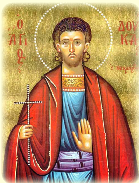
Ὁ Άγιος Νεομάρτυς Δούκας ὁ ῥάπτης, ὁ ἐκ Μυτιλήνης καὶ ἐν ΚωνΠόλει μαρτυρήσας