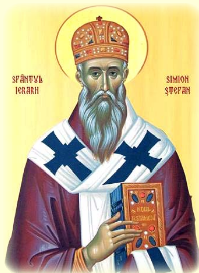
Ό Άγιος Συμεών -Στέφανος ό Όμολογητής, Μητροπολίτης Άλμπα -Ιουλίας και Τρανσυλβανίας (1643-1656)