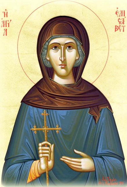
Ἡ Ὁσία Ἐλισάβητ, ἡ Θαυματουργὸς ἐν Κων/πόλει