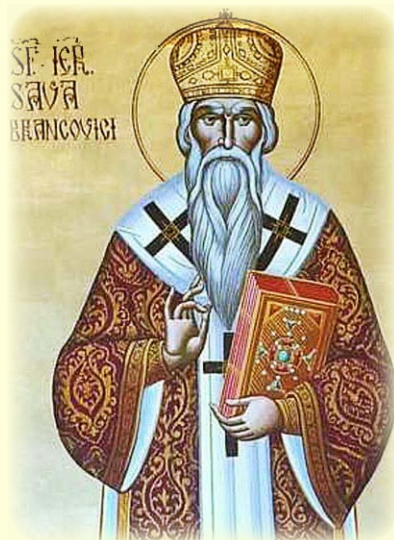
Ό Άγιος Σάββας ό Όμολογητής, Μητροπολίτης Άλμπα -Ιουλίας και Τρανσυλβανίας (1656-1683)