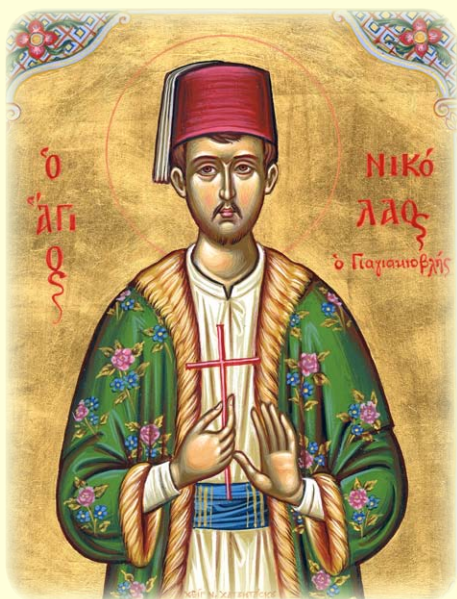
Ὁ Άγιος Νεομάρτυς Νικόλαος, ὁ ἐν Μαγνησίᾳ