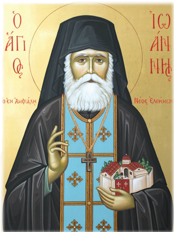
Ἡ ἱερὰ Εἰκὼν τοῦ Ἁγίου Ἰωάννου τῆς Ἀμφιάλης. Ἔργον τοῦ «Ἐργαστηρίου Ἐκκλησιοποιημένης Εἰκονογραφίας». Φεβρουάριος 2018, Φυλὴ Ἀττικῆς