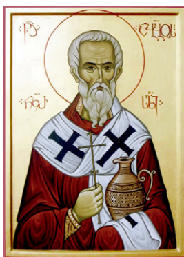
Ὁ Ἅγιος Ἱερομάρτυς Ἄβιβος, Ἐπίσκοπος Νέκρεσι

Ἡ φήμη γιὰ τὶς πράξεις τῶν δεκατριῶν Ἀγίων Σύρων Πατέρων αὐξήθηκε μεταξὺ τοῦ λαοῦ σὲ τέτοιο βαθμὸ, ὥστε ὁ Καθολικὸς-Ἀρχιεπίσκοπος Γκρούτζια Εὐλάμπιος (533-544) πρότεινε στὴν Σύνοδο τῶν Ἐπισκόπων νὰ ἐκλέξη μερικὸς ἐξ αὐτῶν τῶν Ἀσκητῶν γιὰ τὶς κενές Ἔδρες τῶν Ἐπισκοπῶν Νεκρέσι καὶ Τσίλκανσκ.