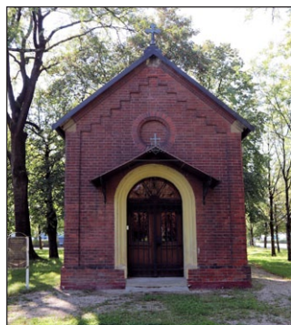
Παρεκκλήσι στὸν τόπο τοῦ θανάτου τοῦ Ἁγίου Ἐμμέραμνου στὸ Φέλντκιρτσεν Μονάχου (Feldkirchen).

κῶν. Πρὶν νὰ ξεκινήσῃ τὸ ἄρμα τοῦ Ἁγίου, ἐφανίσθησαν ἑξαφνα δύο ἵππεις, μὲ θαυμάσια ἐμφάνισι, ὅπως δὲν εἶχαν δεῖ ποτὲ ἐδῶ. Ἐρώτησαν γιὰ τὸ ποῦ εὐρίσκονται τὰ μέλη τοῦ μαρτυρικοῦ ἀνδρός. Τοὺς ἐδειξαν ἕναν κράταιγο (φυλλοβόλο θάμνο) κάτω ἀπὸ τὸν ὁποῖο εἶχαν τοποθετηθῆ τὰ κομμένα μέλη. Σύμφωνα μὲ τὶς ιδέες τῆς ἐποχῆς, ὅσοι ἔχχαναν τὰ ἄκρα τους δὲν θὰ ἔβλαπταν ἂν ἦταν καλυμμένοι μὲ χῶμα. Μόλις οἱ δύο καβαλλάρηδες σήκωσαν τὰ μέλη, ἔγιναν ἄφαντοι. Τότε ἄνοιξαν τὰ μάτια τοῦ κόσμου, ὅτι ἡ ἐκτέλεσις τοῦ Ἐπισκόπου ἦταν τὸ μαρτύριο ἐνὸς ἀθώου. Ὡς ἐκ τούτου, πολλοὶ κάτοικοι τοῦ τόπου συνώδευσαν τὸν ἀκρωτηριασμένο Ἐπίσκοπο. Τὸ κάρο συνώδευαν καὶ γυναῖκες. Στὸ δρόμο, καθὼς ἐπλησίασαν πολὺ στὸ Ἴσαρ (Isar), ὁ Ἐμμέραμνος ἐφώνησε καὶ ἔδωσε νὰ καταλάβουν, ὅτι εἶχε ἔλθει ἡ στιγμή τοῦ θανάτου του καὶ ὅτι ἔπρεπε νὰ τὸν σηκώσουν ἀπὸ τὸ κάρο. Τὸν ἐσήκωσαν λοιπὸν ἀπὸ τὸ κάρο καὶ τὸν ἐξάπλωσαν στὸ φρέσκο γρασίδι. Ἐκεῖ ὁ Ἅγιος παρέδωσε τὸ πνεῦμά του εἰς χεῖρας Θεοῦ.