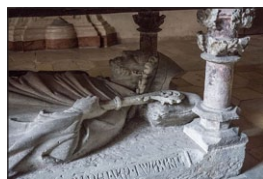
Ὁ Τάφος τοῦ Ἁγίου Ἐμμεράμνου. Ρέγκενσμπουργκ.

Ἡ ἐπιγραφή στὸν σημερινὸν τάφον γράφει: «Ἐμμεράμνος, Ἐπίσκοπος Πονατιέ. Ἦλθε κηρύτ-