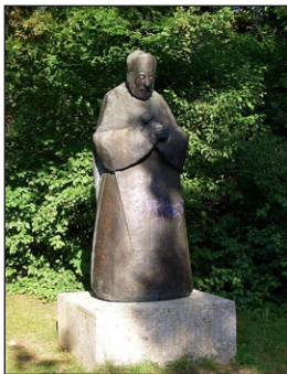
Ἄγαλμα τοῦ Ἁγίου Ἐμμεράμνου, πλησίον τῆς ὁμωνύμου γέφυρας στὸ Μόναχο.

Ο ταν οἱ σύντροφοι τοῦ Ἁγίου ἦλθαν, ἐθρήνησαν τὸν Ἐπίσκοπό τους. Ο Ἐμμέραμος ζήτησε λίγο νερό. Ο δὲ Βιτάλιος τοῦ ἀντέτεινε, πῶς ζητάει νερό, ἀφοῦ ἔμεινε χωρὶς ἄκρα, ἔπρεπε νὰ θελήσῃ νὰ πεθάνῃ παρὰ νὰ ἀγωνίζεται νὰ ζήσῃ ἄλλο. Ο Ἐμμέραμος τοῦ ἀπήντησε, ὅτι ἔπρεπε νὰ παρατείνῃ κανεὶς τὸ τέλος τῆς ζωῆς του γιὰ νὰ μετανοήσῃ. Ω ς πρὸς τὰ ἀπερίσκεπτα λόγια του, προεῖπε στὸν Βιτάλιο, ὅτι στὸ μέλλον θὰ ἔβαζε ἓνα ποτὸ στὸ στόμα του μὲ τὸ ὁποῖο θὰ ἔχανε τὸ μυαλό του, χωρὶς ὅμως νὰ βλάβῃ κανέναν, πρὸς παραδειγματισμὸ ὅλων.