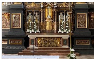
Ἡ ἱερὰ Λάρνακα τοῦ Ἁγίου Ἐμμεράμνου.

Μία ἄλλη φορά, μία ὑπρέτρια ἔπεσε θῦμα μαγείας καὶ ἄρχισε νὰ νιώθῃ μία ἀνυπέρβλητη ἀποστροφή γιὰ κάθε φαγητό. Ἄν τῆς ἔβαζες μὲ δύναμι κάτι στὸ στόμα, θα τὸ ἔφτυνε ἀμέσως, ἀναμιγμένο μὲ αἷμα. Γιὰ ἕνα ἔτος ἔζησε ἔτσι, ἐνῶ ἔκανε τὴν ὑπηρεσία της ὡς συνήθως, καὶ μόνο ἡ ὠχρότητα τοῦ προσώπου τῆς πρόδιδε τὴν κατάστασί της. Τότε , κάποιος φιλόθεος τῆς συνέστησε νὰ κἀνῃ προσκύνημα στὸν Ἅγιο Ἐμμεράμνο. Καθὼς ἐπλησίαζαν στὸν Ναό, ὅπου ἀναπαύονται τὰ Λεῖψανα τοῦ Ἁγίου, ἡ ὑπρέτρια ἔνιωσε μεγάλη πείνα καὶ ἐζήτησε ψωμί. Ἄφου προσεκύνησε τὰ Λεῖψανα, ἐπέστρεψε στὸ σπίτι θεραπευμένη.