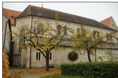
Ναὸς τοῦ Ἁγίου Ροβέρτου στὸ Ἄββαεῖο τοῦ Ἁγίου Ἐμμεράμνου. Ρέγκενσμπουργκ..

Ὅ ταν κάποιος ἔγγαμος ἄνδρας ἀπέθανε, τὸν διέταξε ὁ Πρίγκιπας νὰ λάβῃ ὡς σύζυγο τὴν χήρα του. Ἐ κεῖνος ὁμως ἀρνήθηκε, ἐπισημαίνων ὅτι ἦταν Χριστιανὸς καὶ ἤδη συζευγμένος, καὶ ὅτι ἡ σύζυγός του ἦταν ἀκόμη ζωντανὴ καὶ ὡς ἐκ τούτου δὲν ἐπετρεπόταν νὰ ἔλθῃ σὲ δεῦτερο γάμο. Ὡ στόσο, αὐτὸ ἐρμηνεύθηκε ὡς μυστικὸ σχέδιο ἀποδράσεως καὶ ἀπειλήθηκε νὰ πωληθῆ στοὺς πλέον ἄγριους Σάξονες, γιὰ νὰ μὴν χάσουν οἱ κύριοι του τὴν τιμὴ τῆς ἀγορᾶς του. Τ ελικὰ, ὁ ἄνδρας ἐνέδωσε στὸν γάμο. Τ ὴν νύκτα τοῦ γάμου, ὡστόσο, προσπάθησε νὰ πείσῃ τὴν νέα του σύζυγο νὰ προσποιηθῆ, ὅτι ἔκαναν ἕναν κανονικὸ ἔγγαμο βίον, ἀφοῦ, ὅπως ἤδη ἀναφέρθηκε, εἶχε ἤδη σύζυγο. Ἀ λλὰ ἡ νέα του σύζυγος δὲν συμφωνοῦσε καθόλου. Τ ότε τῆς ἐξήγησε ὅτι, σύμφωνα μὲ τὸ χριστιανικὸ ἔθιμο, ἔπρεπε νὰ περιμένουν τουλάχιστον τρεῖς ἡμέρες πρὶν νὰ συνέλθουν. Σ ὲ αὐτὸ τὸ διάστημα ὁ ἄνδρας αὐξήσε τὶς προσευχάς του καὶ ἐνήστευε. Τ ὸ ἐπόμενο βράδυ, ὁ Ἅγιος Ἐμμέραμνος τοῦ ἐφανίσθηκε σὲ ὄνειρο καὶ τὸν διέταξε νὰ πάρῃ τὸ ψωμὶ, τὸ ὁποῖο ἦταν στὸν ἐπάνω ὄροφο καὶ νὰ ἐπιστρέψῃ ἀμέσως στὴν Βαυαρία. Π ρὸς ἐκπληξίν του, ὁ ἄνδρας βρῆκε τὸ ψωμὶ ἐκεῖ ὅπου τοῦ εἶχε ὑποδείξει ὁ Ἅγιος στὸ ὄνειρο καὶ ἔφυγε ἀνενόχλητος ἀπὸ τὸ σπίτι τὸ ἴδιο βράδυ. Μ ὲ τὴν βοήθεια αὐτοῦ τοῦ ψωμοῦ ἔταξίδευσε γιὰ δεκατέσσερις ἡμέρες ἕως τὴν