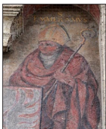
Ὁ Ἅγιος Ἐμμέραμνος. Τοιχογραφία στὴν εἴσοδο τῆς Μονῆς. Ρέγκενσμπουργκ.

Ἡ παράδοσις ἀναφέρει ἐπίσης γιὰ κάποιον εὐσεβῆ ἄνθρωπο, ὁ ὁποῖος μετέβαινε νὰ προσκυνήσῃ τὰ Λείψανα τοῦ Ἁγίου Ἐμμεράμνου. Σ τὸν δρόμο συνάντησε ληστές, οἱ ὁποῖοι τὸν συνέλαβαν καὶ τοῦ ἐκλείσαν τὸ στόμα, ὥστε νὰ μὴν μπορῆ πλέον νὰ μιλήσῃ. Ἐ πειτα τὸν μετήγαγαν στὴν Γαλλία, ὅπου τὸν ἐπούλησαν ὡς σκλάβο. Σ τὸ διάστημα αὐτό, ὁ ἄνδρας συχνὰ νήστευε καὶ προσευχόταν θερμὰ στὸν Θεὸ καὶ στὸν Ἅγιο Ἐμμέραμνο. Ἐ να ἔτος ἀργότερα, πουλήθηκε στὴν βόρεια Γερμανία, στοὺς Γουέσερ (Weser), μία φυλὴ ἢ ὁποία ἦταν ἀκόμα παγανιστικὴ. Ἐ κεῖ ἐκέρδισε τὸν σεβασμὸ τοῦ τοπικοῦ Πρίγκιπος λόγῳ τῆς ἰκανότητός του στὴν κατασκευὴ οἰκιῶν καὶ ἄλλων χειρωνακτικῶν δεξιοτήτων.