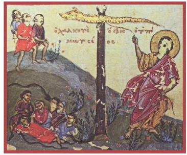
Ὁ Μωϋσῆς ὑψώνει τὸ χάλκινο φίδι. Χειρόγρ. Μονῆς Βατοπεδίου 602, φ. 166β. Οἱ Θεσαυροὶ τοῦ Ἁγίου Ὄρους, Πατριαρχ. Ἰδρυμα Πατερικῶν Μελετῶν, Ἐκδοτ. Ἀθηνῶν, τ. 4ος.

Ὁ Ἅγιος Ἀνδρέας , Αρχιεπίσκοπος Κρήτης καὶ ποιητῆς τριῶν τροπαρίων τοῦ Ἑσπερινοῦ τῆς Ἑορτῆς, ἐρμηνεύει στὸν α' Λόγο του εἰς τὴν Ὑψωσιν, τὸν τρόπο μὲ τὸν ὁποῖο ταυτίζονται οἱ ἔννοιες ὕψος καὶ δόξα καὶ προσθέτει: Ἐπειδὴ λοιπὸν εἶναι ὕψος ἢ δόξα, ὑψώνεται σήμερα ὁ Σταυρὸς καὶ δοξάζεται ὁ Χριστός. Γιατί , ἂν δόξα τοῦ Χριστοῦ εἶναι ὁ Σταυρὸς, σήμερα ὑψώνεται αὐτός, γιὰ νὰ δοξασθεῖ ὁ Χριστός. Δὲν ὑψώνεται ὁ Χριστός, γιὰ νὰ δοξασθεῖ ὁ Σταυρὸς, ἀλλὰ ὑψώνεται ὁ Σταυρὸς, γιὰ νὰ δοξασθεῖ ὁ Χριστός. Καὶ δοξάζεται ὁ Χριστός, γιὰ νὰ συνανψώσει μαζί Του καὶ μᾶς. Ὑψώνεται λοιπὸν ὁ Σταυρὸς καὶ συνανψώνει τῶν εὐσεβῶν πιστῶν τὸ φρόνημα. Δοξάζεται ὁ Χριστός καὶ συνδοξάζει ἐκείνους πὺν Τὸν δοξάζουν.