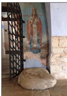
Μέρος του βράχου.

Θάλασσα με τὸ πρωτοφανὲς αὐτὸ πλεούμενο, πέρασε τὸν Ἀτλαντικὸ Ὠκεανὸ καὶ τὴν Βαλτικὴ Θάλασσα, εἰσῆλθε στὸν ποταμὸ Νέβα, πέρασε τὴν λίμνη Λάντογκα καὶ ἀνεβαίνων τὸν ποταμὸ Βαλκόβ, ἔφθασε στὸ Νόβγκοροντ, δοξάζων καὶ εὐχαριστῶν τὸν Θεόν, ὁ Ὅποιος τὸν εἶχε φέρει σὲ ὀρθόδοξη χώρα.