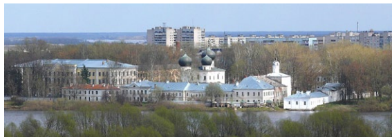
Ἡ Μονὴ τοῦ Γενεθλίου τῆς Θεοτόκου. Νόβγκοροντ.

(*) Βλ. https://proskynitis.blogspot.com/2022/08/blog-post_32.html?m=1 • Ἐπιμέλ. ἡμετ.