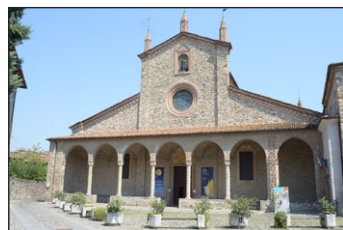
Ἡ Μονὴ τοῦ Μπόμπιο. Ἰταλία.

Μετέβη τότε στὸν Ἰούρα γιὰ νὰ ἐγκατασταθῆ ἐκεῖ στὸ ἐρημητήριο, τὸ ὁποῖο εἶχε ἰδρῦσει ὁ Ἅγιος Οὐρσικιανὸς ἢ Οὐρσανὸς ἢ Οὐρσίκιος (St. Ursan, Ursanne, Ursannus, Ursicin, Ursicinus, Hursannus, Ursitz, Oschanne, † Μνήμη: 20ῆ Δεκεμβρίου).