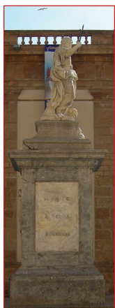
Ἄγαλμα τοῦ Ἁγίου Βίτωνος στήν γενέτειρά του Μασάρα ντέλ Βάλλο.

ρία τους. Μετὰ ἀπὸ αὐτὸ οἱ ἅγιες ψυχές τους μὲ τιμὴ καὶ δόξα ὠδηγήθηκαν στὸν Οὐρανό, στὶς 15 Ἰουνίου τοῦ ἔτους 303. Τὰ σώματα αὐτῶν τῶν καλλινίκων Μαρτύρων ἐνταφιάσθηκαν ἀπὸ τοὺς πιστοὺς στὴν περιοχὴ Μαριάνο (Mariano).