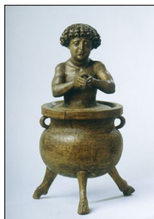
Γλυπτό τοῦ Ἁγίου Βίτωνος ἀπὸ ξύλο φλαμουριάς. Γερμανικὸ Ἐθνικὸ Μουσεῖο Νυρεμβέργη. 1520.

Ὁ Διοκλητιανὸς ἐρώτησε τὸν Ἅγιο, ἐὰν εἶχε τὴν δύναμι νὰ θεραπεύσῃ τὸν υἱό του. Ἐ κεῖνος ἀπάντησε, ὅτι τοῦτο δὲν θὰ ἦταν δυ-