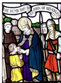
Βιτρώ με το Θαύμα του Άγίου Ίωάννου. Ακόμπ, Νορθουμβρία.

Σ ύμφωνα με την Παράδοσι, ο Άγιος Ίωάννης