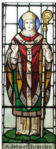
S. John of Beverley Βιτρώ με τὸν Ἅγιο Ἰωάννη. Ἀκόμπ, Νορ- θουμβρία.

ἦταν αὐτὸς ποὺ ἐχειροτόνησε τὸν νεαρὸ Ὅσιο Βέδα Διάκονο καὶ ἀργότερα Ἱερέα.