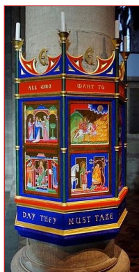
Μνημειακή στήλη πρὸς τιμὴν τοῦ Ἁγίου Ἐθελβέρτου, μὲ σκηνὲς ἀπὸ τὴν ζωὴ του. Χέρφορντ (Hereford)

νογράφος Τζέραλντ τῆς Οὐαλλίας (Gerald of Wales, περ. 1146-1223), ὁ Ματθαῖος Πάρις τοῦ Σεντ Ἄλμπανς (Matthew Paris of St. Albans, περ. 1199-1259) καὶ ὁ ἀνήλικος ἱστορικὸς Ρίτσαρντ τοῦ Τσίρενσεστερ (Richard Cirencester, † ἀρχὲς τοῦ ΙΕ' αἰ.).