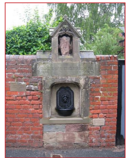
Πηγή τοῦ Ἁγίου Ἐθελβέρτου. Χέρεφορδ.

Ἀ φοῦ ἐθανάτωσε τὸν Ἐθελβέρτο, ὁ Ὕοφφα δι-