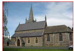
Καθεδρικὸς Ναός. Χέρεφορντ.

Σ ήμερα οἱ τόποι οἱ ὁποῖοι συνδέονται μὲ τὸν Βίο καὶ τὸ Μαρτύριο τοῦ Ἁγίου Ἐθελβέρτου διατηροῦν ἀκόμη τὴν μνήμη του καί, ὅπως τὸ νιώθουν οἱ προσκυνητές, εἶναι γε-