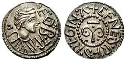
Νόμισμα μὲ τὴν μορφή τῆς Βασιλίσσης Κύνεθρυθ.

Καθὼς ὁ εὐσεβὴς Ἐθελβέρτος ἐπλησίαζε τὸ βασιλικὸ παλάτι, ἡ νεαρὰ Ἀλφρέδα, ἡ ἐπίδοξη μνηστή του, τὸν εἶδε ἀπὸ τὸ παράθυρο. Ἡ νεαρὰ πριγκίπισσα ἔτρεξε ἀμέσως στὴ μητέρα της καὶ ἀνεφώνησε: «Ἀγαπητὴ μητέρα! Ὁ Βασιλεὺς Ἐθελβέρτος ἦλθε!