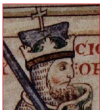
Ὁ Βασιλεὺς τῆς Μερκίας Ὀφφα. (757-796)

πανικοβληθοῦν. Ἡ Λεοφρούνα εἶδε σὲ αὐτὸ ἓνα σημεῖο ἀπὸ τὸν Κύριο, ὅτι ὁ υἱὸς τῆς δὲν θὰ ἐπέστρεφε ποτὲ ζωντανὸς στὸ σπίτι. «Ἄς γίνῃ τὸ θέλημα τοῦ Θεοῦ!», ἀνεφώνησε ὁ Ἐθελβέρτος. Ὁμως ἀκολούθησε ἓνα ἄλλο σημεῖο. Ὁ ἥλιος σκοτεινίασε καὶ γύρωθεν αὐτοῦ σχηματίσθηκε τόσο πυκνὴ ὁμίχλη, ὥστε ὅλοι ὅσοι συνώδευαν τὸν Βασιλέα δὲν μπορούσαν νὰ δοῦν ὁ ἓνας τὸν ἄλλον ἢ ὁ,τιδήποτε κοντὰ τους.