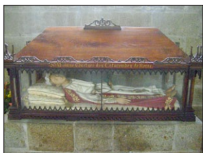
Ἐρὸ Λείψανο Ἁγίας Βιβιάνας.

Ἄ λλὰ συνέβη τὸ ἀντίθερο, διότι ἡ Δαφρόσα καθωδήγησε τὸν Φαῦστον στὴν Χριστιανικὴ Πίστι, τὸν ἐβάπτισε καὶ τὸν ἐνεθάρρυνε στὴν ὁμολογία του, ὥστε ἐκεῖνος νὰ ἀξιωθῆ τοῦ στεφάνου τοῦ Μαρτυρίου.