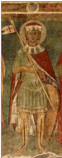
Ὁ Ἅγιος Φλαβιανός.

Ὅταν ἡ Δαφρόσα ἐπέστρεψε στὴν Ῥώμη, ὁ Ἀπρονιανὸς τὴν ἐφυλάκισε καὶ κατόπιν ἐσχεδίασε νὰ τὴν ἐξαναγκάσῃ νὰ ὑπανδρευθῆ πάλι κάποιον εἰδολωλάτρη, Φαῦστον λεγόμενον, μὲ τὴν ἐλπίδα ὅτι κατ' αὐτὸν τὸν τρόπον θὰ μπορούσε νὰ ἐγκαταλείψῃ τὴν πίστι τῆς, ὡς καὶ τὸν εὐαγγελικὸ τρόπο ζωῆς τῆς, ὁ ὁποῖος ἦταν πλήρη ἐλέους καὶ ἀγαθοεργιῶν.