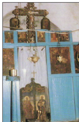
Τὸ τέμπλο τῆς Ἐκκλησίας Ἁγίου. Ἰωάννη τοῦ Βουνοῦ.