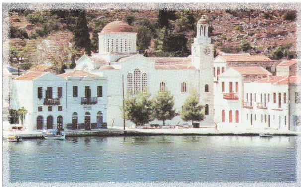
Ο Άγιος Γεώργιος (του Πηγαδιού).