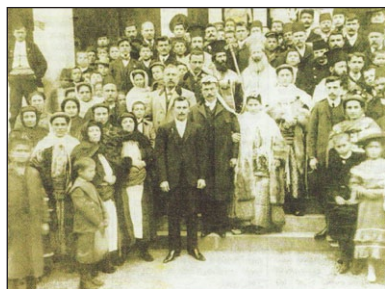
Ὁ τελευταῖος Μητροπολίτης Πισιδίας Κωνσταντῖνος εὐλογεῖ γάμο Καστελλοριζιῶν. Στὴν καθιερωμένη φωτογραφία στὰ σκαλοπάτια τῆς Σαντραπείας Σχολῆς τοῦ Καστελλόριζου. (26 Ἰουλίου 1907).