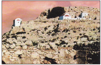
Ὁ λόφος τοῦ Παλαιόκαστρου μὲ τὰ ἐκκλησιάκια.