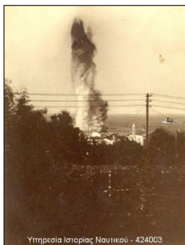
Υπηρεσία Ιστορίας Ναυτικού - 424003

Ἡ στιγμή τῆς ἔκρηξης μιάς ἐκ τῶν τορπιλῶν στήν προβλήτα τοῦ λιμανιοῦ τῆς Τήνου, στίς 15 Αὐγούστου 1940. Ἡ Ἕλλη διακρίνεται στήν δεξιὰ πλευρὰ τοῦ στόλου.