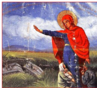
Ἡ πρώτη ἀναπαράσταση τοῦ Θαύματος. Τμῆμα ἀπὸ τὸ λάβαρο, τὸ ὁποῖο κατασκευάσθηκε καὶ μὲ χρήματα τοῦ Γερμανοῦ Ἀξιωματικοῦ Ὁφμαν.

Ἦταν βράδυ τῆς 9ης Σεπτεμβρίου τοῦ 1943, ὅταν μία ὁμάδα πάνοπλων Γερμανῶν ἔφτασε στὸν Ὁρχομενὸ μὲ σκοπὸ νὰ πυρπολήσει τὴν πόλη γιὰ νὰ τιμωρήσει κάποιους κατοίκους ποὺ τόλμησαν νὰ ἐπιχειρήσουν, χωρὶς ἐπιτυχία, νὰ πάρουν ἀπὸ τὸν σιδηροδρομικὸ σταθμὸ τῆς Λιβαδειᾶς τὸν ὄπλισμὸ τῶν Ἰταλῶν, οἱ ὁποῖοι εἶχαν συνθηκολογήσει. Τὸ φρικτὸ νέο διαδίδεται καὶ ἀγωνία θανάτου γεμίζει τὶς ψυχὲς ὄλων. Κλεισμένοι στὰ σπίτια τους, καταφεύγουν στὴν μόνη Ἐλπίδα τους, στὴν Κυρία Θεοτόκο, ποὺ χίλια καὶ πλέον χρόνια εἶναι ἡ Βασίλισσα στὸν τόπο τους.