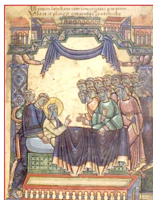
Ὁ Ἅγιος Αὐβίνος δίδει τις τελευταῖες νουθε- σίες του πρὶν ἀπὸ τὴν κοίμησίν του.

θεῖα Εὐσπλαχνία μὲ πλῆθος θαυματουργιῶν, μεριμνοῦσε γιὰ τὸ καθημερινὸ κήρυγμα, τόσο ἀπαραίτητο γιὰ τὴν ψυχὴ, ἔλεγε, ὅσο τὸ ψωμὶ γιὰ τὸ σῶμα.