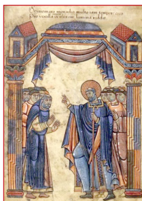
Ὁ Ἅγιος Αὐβίνος εὐλογεῖ τοὺς πιστοὺς.