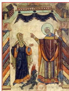
Ὁ Ἅγιος Αὐβίνος ἐλευθερώνει μία δαμονισμένη.