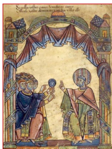
Ὁ Ἅγιος Αὐβίνος παρουρίσκειται στὴν Σύνοδο τῆς Ὁρλεάνης (538).