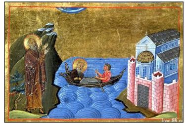
Βυζαντινὴ μικρογραφία τῆς Μονῆς Στουδίου. Μηνολόγιον Βασιλείου Β'.

Ἄ λλοι συγγραφεῖς τοῦ ἐνάτου αἰῶνα, τῶν ὁποίων τὸ ἔργο βρίσκεται