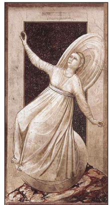
Ἡ μεταβλητότητα. Ἔργο τοῦ Giotto di Bondone.

Οἱ ψυχικὲς μεταπτώσεις συμβαίνουν σὲ ὅλους. Δὲν ἔχετε, λοιπόν, παρὰ νὰ τὶς ὑπομένετε ἡρεμα, ἀφήνοντας τὸν ἑαυτὸ σας στὰ χέρια τοῦ Θεοῦ. Μὴ νοιάζεστε γιὰ τίποτε ἄλλο, παρὰ μόνον γιὰ τοῦτο: Νὰ εἶστε πάντα μαζί μὲ τὸν Κύριο. Ὅ ,τι καὶ ἂν σᾶς συμβαίνει, σὲ Αὐτὸν νὰ καταφεύγετε, σὲ Αὐτὸν νὰ ἀποκαλύπτετε τὴν ψυχὴ σας, σὲ Αὐτὸν νὰ ἀκουμπᾶτε τὰ βάρη σας, σὲ Αὐτὸν νὰ λέτε τὸν πόνο σας... Καὶ νὰ προσεύχεστε, παρα-