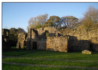
Μονὴ Ἁγίου Πέτρου, Γουέρμουθ (ἀριστερά). Ὅσιος Βενέδικτος (μέσον). Μονὴ Ἁγίου Παύλου, Γιάρρου (δεξιά).