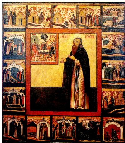
Ὁ Ὅσιος Μιχαήλ μὲ σκηνές ἀπὸ τὸν βίο του. Ρωσία, ΙΖ΄ αἰ. Κρατικὸ Ἱστορικὸ Μουσεῖο.

Τῷ δὲ ἐν Τριάδι Παναγίῳ Θεῷ, τῷ ἐνδοξαζομένῳ ἐν τοῖς Ἁγίοις Αὐτοῦ, προσκύνησις καὶ εὐχαριστία, εἰς τοὺς αἰῶνας τῶν αἰῶνων. Ἀμήν!