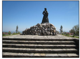
Μνημεῖο γιά τήν καταστροφή τῆς Νάουσας.

Ἀμπντούλ Ἐμποῦ Λουμπούτ (ὁ ροπαλοφόρος), μέ 15.000 στρατιῶτες καί 12 κανόνια. Τ ό ἐκστρατευτικό σῶμα ἀκολουθοῦσαν καί 600 Ἑβραῖοι, οἱ ὁποῖοι εἶχαν πληρώσει τούς Τούρκους γιά τήν ἀπόκτηση τῶν δικαιωμάτων πάνω στούς ἐν δυνάμει σκλάβους καί τήν πώλησή τους στά σκλαβοπάζαρα τῆς ἐποχῆς.