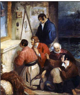
Ναυτικοὶ προσεύχονται στὴν Παναγία. Διονυσίου Τσόκου.

Μόνοι μας ἀπὸ ἀνθρώπους, ἔθνος ἀνάδελφο, μόνο μέ τὴν στηριξη τοῦ Θεοῦ, τῆς Ἁγίας καί Ὁμοουσίου καί Ἀδιαιρέτου Τριάδος, μέ τὴν προστασία τῆς Ὑπερμάχου Στρατηγοῦ Παναγίας μας, τῆς Ἐλευθερώτριας καί Ἁγίας Σκέπης καί Ὁδηγήτριας, καί τῶν πολεμιστῶν Ἁγίων τῆς Πίστεώς μας: Γεωργίου τοῦ Τροπαιοφόρου, Δημητρίου τοῦ Μυροβλήτου, Θεοδώρων Τήρωνος καί Στατηλάτου,