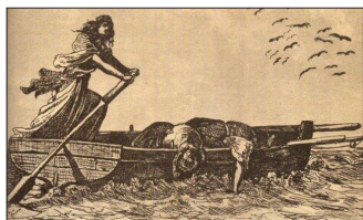
Ἔπειτα ἀπὸ τὴν καταστροφή τῆς Κάσου. Πίνακας τοῦ ζωγράφου Γ. Μηνιάτη.

Καί ὁ χορὸς τῆς Θυσίας συνεχίζεται: Στίς 27 Μαΐου τοῦ 1824 ὁ στόλος τῆς Αἰγύπτου ἐπετέθη στὴν νῆσο Κάσσο μέ 45 πλοῖα ἐφοδιασμένα μέ τέσσερις χιλιάδες στρατό ὑπὸ τοῦ Χουσεῖν Μπέη. Ἔκαναν ἀπόβαση σέ ἀπόκρημνο μέρος καὶ κυριεύσαν τὸ νησί. Στίς 30 Μαΐου (νέο ἡμερολόγιο) ἀκολούθησε καταστροφή τοῦ νησιοῦ, σφαγὴ τῶν νησιωτῶν, αἰχμαλωσία τῶν γυναικῶν καὶ τῶν παιδιῶν. Ὅσοι μπόρεσαν κατέφυγαν στό βουνό, ἐνῶ ἄλλοι προσκύνησαν.