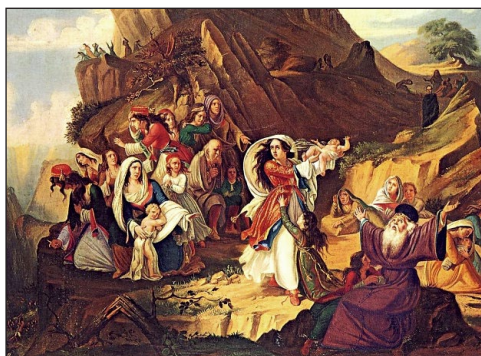
‘Ο χορός του Ζαλόγγου, ή Οι Σουλιώτισσες. Έργο του Claude Pinet. Έλαιογραφία σέ καμβά. Αθήνα, Μουσείο Μπενάκη.

σημο σέ ὄλη τήν πόλη, μέ τίς σημαίες στά Δημόσια Κτίρια νά κυματίζουν μεσίστια, τό δέ Δημοτικό Συμβούλιο ἐξέδωσε ψήφισμα ὅπου ἀπεύθυνε ἐκκληση πρός τό λαό τοῦ Λιβόρνο νά τιμᾷ «τὴν πλέον ἔνδοξο γυναίκα πού εἶχε τό Λιβόρνο πού τό πνεῦμα καί ἡ δράση της θαυμάστηκε ἀπό τοὺς ἐξοχότερους ἄνδρες, Ἰταλούς καί ξένους, νά τιμῆσει τίς ἀρετές της, τὴν μεγαλοφυΐα της καί τὴν εὐγενική