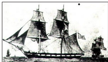
Τό μεγαλοπρεπές πλοῖο τῆς οἰκογένειας Βισβίζη, ἡ «Καλομοῖρα».

Στίς 21 Ἰουλίου τοῦ 1822, ὁ καπετάν Βισβίζης, ἐπικεφαλῆς ἑνός στόλου ἀπό 30 πλοῖα μικρά καί μεγάλα, βρίσκεται στόν Μαλιακό κόλπο. Μέ τόν Ἀνδρουῦτσο, τόν Δυοβουνιώτη κι ἄλλους ὀπλαρχηγούς, δίνουν μεγάλη μάχη, στήν διάρκεια τῆς ὁποίας, μπροστά στά μάτια τῆς Δόμνας σωριάζεται νεκρός ὁ γενναῖος ἄνδρας της. Διατάζει νά τόν μεταφέρουν στό ἀμπάρι καί ἀναλαμβάνει τήν ἀρχηγία τοῦ ἀγώνα. Πρέπει νά δικαιώσει τόν θάνατο καί τούς ἀγῶνες τοῦ καπετάνιου της! Καταπιέζον-