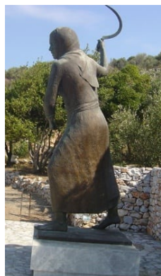
Ἡ Μανιάτισσα μὲ τὸ δρεπάνι.