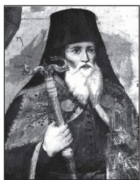
Οἰκουμενικὸς Πατριάρχης Γεννάδιος Σχολάριος Β΄.

Μ άλιστα, ἔθεσε τὸν Πατριάρχη ἐπικεφαλῆς (millet basi) ὄλου τοῦ Ὀρθοδόξου Χριστιανικοῦ Γένους. Αὐ τὸ σήμαινε, ὅτι στὴν Ὀθωμανικὴ Αὐτοκρατορία παρὰ τὸ ὅτι ὑφίστατο ὄξυς διαχωρισμὸς μεταξὺ Μωαμεθανῶν καὶ μὴ Μωαμεθανῶν, ἐν τούτοις ἐπικρατοῦσε κάποια μορφή ἀνοχῆς, θεωρητικὰ τουλάχιστον, ἡ ὁποία ἐπέτρεπε τὴ συμβίωση τῶν λαῶν τῶν ποικίλων ἐθνικῶν καὶ πολιτιστικῶν καταβολῶν τῆς Αὐτοκρατορίας. Τ ὰ μέλη κάθε Θρησκείας θεωροῦνταν ὅτι ἀνήκουν σὲ ἓνα Γένος ἢ ἓνα Ἔθνος (millet) καὶ ὁ θρησκευτικὸς ἀρχηγὸς της ἦταν ὑπεύθυνος ἐναντι τοῦ Μωαμεθανικοῦ κράτους γιὰ τὴν ὑπακοή καὶ συμμόρφωση τῶν μελῶν τῆς Θρησκευτικῆς του Κοινότητος ἐναντι τῆς κεντρικῆς ἐξουσίας.