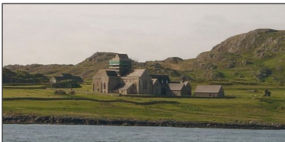
Ἡ Μονὴ τοῦ Ὁσίου Κολόμπα. Ἀϊόνα, Ἴρλανδία.

Ὅ ταν δὲν εὐρίσκετο στοὺς δρόμους, παρέμενε στὴν Μονή, ὅπου μεγάλο πλῆθος ἐπισκεπτῶν, ταπεινῆς ἢ εὐγενικῆς καταγωγῆς, προσήρχετο γιὰ νὰ θαυμάσῃ τις ἀρετὲς του καὶ νὰ λάβῃ τις συμβουλές του. Γ ονάτιζε ἐνώπιόν τους, ἔνιπτε τὰ πόδια τους καὶ κατόπιν τοὺς ἀσπάζετο μετὰ ἀγάπῃ.