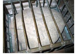
Πέτρα, τὴν ὁποῖα χρησιμοποιοῦσε ὡς μαξιλάρι ὁ Ὅσιος Κολόμπα.