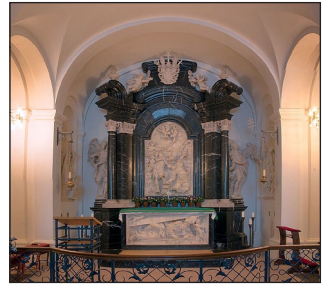
Ὁ Τάφος τοῦ Ἁγίου Βονιφάτιου στὴν κρύπτη τοῦ Καθεδρικοῦ Ναοῦ στὴν Φούλντα.

Στις 5 Ἰουνίου 754, ὅμως, ἐνῶ αὐτοὶ ἐτοιμάζοντο νὰ λάβουν τὸ Χρίσμα, μία ὁμάδα ἐνόπλων ὤρμησε οὐρλιάζοντας στὸν ἱεραποστολικὸ καταυλισμὸ. Οἱ ὑπηρετές καὶ οἱ σύντροφοι τοῦ Ἁγίου προσπάθησαν νὰ πάρουν τὰ ὄπλα γιὰ νὰ ἀντισταθοῦν, ἀλλὰ ὁ Βονιφάτιος στάθηκε στὴν μέση τῆς συμπλοκῆς καὶ παροτρύνοντας τοὺς ἀνθρώπους του νὰ μὴν ἀνταποδώσουν κακὸ στὸ κακό, ἀναφώνησε: «Ἐφθασε ἐπὶ τέλους ἡ πολυπόθητη ἡμέρα. Ἐ ο καιρὸς ὁ ὠρισμένος γιὰ τὴν ἐπικειμένη λύτρωσί μας. Ἄς παρηγορηθοῦμε λοιπὸν ἐν Κυρίῳ, ἃς δεχθοῦμε τὴν ἀπόφασί Του εὐχαριστώντας Αὐτόν, νὰ ἔχετε ἐμπιστοσύνη σὲ Αὐτόν. Ἐ χει λυτρώσει ἤδη τὶς ψυχές μας!». Ἡ λύσσα τῶν βαρβάρων ἐγίνε ἀκόμη μεγαλύτερη. Ἐ νας ἀνάμεσά τους σήκωσε τὸ ξίφος του καὶ μὲ μία σπαθιά ἔσχι-