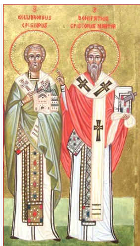
Οί Άγιοι Ουΐλλιμπρορντ και Βονιφάτιος.

ό θάνατος του Πεπίνου του Χέρισταλ είχε προκαλέσει την αντίδραση των ειδωλολατρών, και έτσι είχε υποχρεωθεί να αποσυρθεί στο Μοναστήρι του.