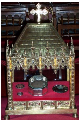
Τὰ ἱερά Λείψανα τοῦ Ἁγίου Βονιφατίου στὸ Ντοκοῦμ Ὁλλανδίας.

σε τὸ χειρόγραφο ποὺ εἶχε σηκώσει ὁ Ἅγιος γιὰ νὰ προστατευθῆ καὶ κατόπιν τὸ κρανί- ο του. Ἐσφαξαν πενήντα δύο ἀπὸ τοὺς συν- τρόφους του καὶ με ξίφη καὶ τσεκούρια ἔκα- ναν κομμάτια λειψανοθήκες καὶ βιβλία ποὺ ἀποτελοῦσαν τὸν μόνο θησαυρὸ τῶν Ἱεραπο- στόλων.