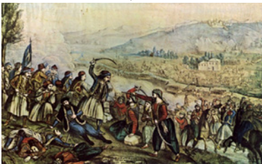
Ἡ Μάχη τῆς Ἀλαμάνας.

Ἡ μάχη ποὺ ἔδωσαν ὁ Διάκος μὲ τὰ λίγα παλληκάρια του ἦταν ἥρω-