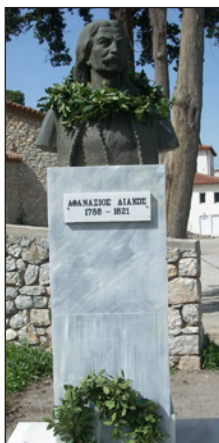
Προτομὴ Ἀθανασίου Διάκου. Λειβαδιά.

Κι' ἔμειν' ὁ Διᾶκος μοναχός, μὲ δεκοχτῶ νομάτους, τρεῖς ἡμεροῦλες πολεμάει καὶ τρία μερονύχτια.