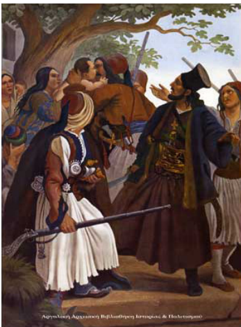
Ὁ Ἀθανάσιος Διᾶκος. Πίνακας τοῦ Ἰ. Ἐσς. Στοὰ τοῦ Μονάχου.

Ἐ χοντας λάβει τὴν ἄδεια τοῦ βοεβόδα τῆς Λιβαδειᾶς Χασὰν Ἀγᾶ, κατορθώνει νὰ στρατολογήσει 5.000 χωρικοὺς, μὲ πρόσχημα τὴν ἀπόκρουση τοῦ Ἀνδρουῦτσου.