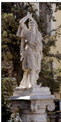
Ἄδριάντας Ἀθανα- σίου Διάκου. Λαμία.

- Π άτε κι' ἐσεῖς καὶ ἡ πίστη σας, μουρτάτες νὰ χαθῆτε, ἐγὼ Γραικὸς γεννήθηκα, Γραικὸς θέλ' ἀπεθάνω.