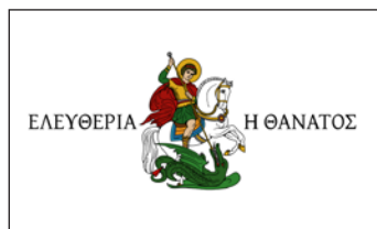
Ἡ σημαία τοῦ Ἀθανασίου Διαῖκου.

Ὁ Διαῖκος ἀντιμετώπισε μὲ θάρρος καὶ γαλήνια τὸν βασιανιστικὸ του θάνατο, στὶς 24 Ἀπριλίου 1821.