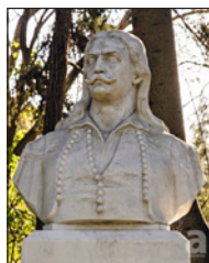
Προτομὴ Ἀθανασίου Διάκου. Λειβαδιά.

Τὸ Διᾶκο τὸν ἐπήρανε καὶ στὸ σουβλί τὸν βάλαν, Ὀλόρθο τὸν ἐστήσανε, κι' αὐτὸς χαμογελοῦσε. Τὴν πίστη τους τοὺς ἔβριζε, τοὺς ἔλεγε μουρτάτες. - Ἐμὲν' ἂν ἐσουβλίσετε, ἕνας Γραικὸς ἐχάθη ἄς εἶν' καλὰ ὁ Ὀδυσσεὺς κι' ὁ καπιτὰν Νικήτας, αὐτοὶ θὰ κάψουν τὴν Τουρκιὰ κι' ὅλο σας τὸ Δοβλέτι.