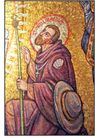
Ὁ Ἅγιος Οὐίλλι-βάλδος.

Τὰ τίμια Λείψανά της μεταφέρθηκαν στὸ Ἄιχστατ, τὸ 870, καὶ χάρις στὴν διασπορὰ πολλῶν τεμαχίων τους, ἡ τιμὴ της διαδόθηκε σὲ ὅλη τὴν δυτικὴ Εὐρώπη.