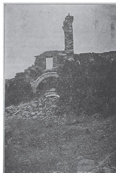
Τὰ εἶρηπια τῶν προπυλαίων τῆς Ἀθωνιάδος Ἀκαδημίας.

Ἀπὸ τὰ ἑλληνικὰ σχολεῖα ποὺ λειτουργοῦσαν