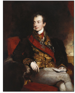
Κλέμενς φὸν Μέτερνιχ. (1773-1859)

Τὸ σπίτι του στὴν Γενεύη, ἓνα τεράστιο φλωρεντινοῦ-νεοκλασικοῦ ρυθμοῦ μέγαρο, τὸ σημερινὸ Δημαρχικὸ Μέγαρο, μετατράπηκε σὲ «στρατηγεῖο» τοῦ εὐρωπαϊκοῦ φιλελληνισμοῦ.