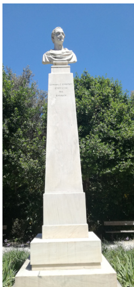
Προτομή Ἐυνάρδου. Ἐθνικὸς Κήπος. Ἔργο τοῦ γλύπτη Ἰωάννου Κόσσου (1866)

τοῦ 1827, εἶχαν σταλῆ στὴν Ἑλλάδα, με φροντίδα τοῦ Ἐυνάρδου, ἀπὸ τὰ ἔλβετικά, γερμανικά καὶ γαλλικά φιλελληνικά κομιτᾶτα τρόφιμα συνολικοῦ βάρους 7,4 ἑκατομμυρίων λιβρῶν, ἐνῶ μέσα στὸ 1827 ἀπέστειλε ἀπὸ ἐράνους πάνω ἀπὸ 800.000 φράγκα. Σ ὲ ἀπολογισμό, τὸν ὁποῖον παρουσίασε ὁ Ἐυνάρδος στὰ τέλη τοῦ 1827, ἀνέφερε ὅτι μόνο ἀπὸ τὸν ἑβδομαδιαῖο ἔρανο τοῦ 1826, εἶχαν ἀποσταλῆ συνολικὲς εἰσφορὲς στοὺς Ἑλληνες πάνω ἀπὸ 2,5 ἑκατομμύρια φράγκα.