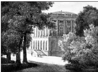
Τὸ σπίτι τοῦ Ἑϋνάργου.

Ο Ἑϋνάργος διακρινόταν γιὰ τὴν εὐφυΐα του, τὴν πίστι του στὴν ὑπόθεσι τῆς Ἑλλάδος, τὴν ἐξαιρετικὴ ὀργανωτικὴ του ἰκανότητα, τὶς γνώσεις του στὰ οἰκονομικά και τὰ διπλωματικά, τὴν ἰσχυρὴ του προσωπικότητα, τὴν ἐντιμότητά του. Ὅλα αὐτὰ τὸν βοήθησαν νὰ συνομιλῇ μὲ βασιλεῖς, πρωθυπουργοὺς,