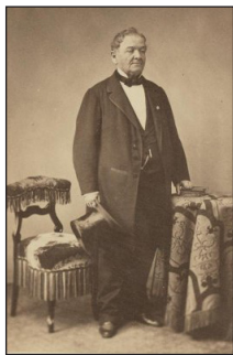
Γεώργιος Σταῦρος. (1788-1869)

Α ὐτὸ δὲν ἀποθάρρυνε τὸν Εϋνάρδο και σὲ συνεργασία μὲ τὸ πρῶην οἰκονομικὸ στέλεχος τῆς Ἐθνικῆς Χρηματιστικῆς, τὸν Γεώργιο Σταῦρο, και τὸν Ρενύ, Γενικὸ Ἐπιμελητὴ τῆς οἰκονομικῆς διαχειρίσεως στὴν Ἑλλάδα, συνέχισε τὶς προσπάθειες και ὑπερέβη ὅλα τὰ ἐμπόδια και τὶς δυσκολίες, καθὼς και τὴν ἀναβλητικότητα τοῦ Ὁθωνος. Ἐ τσι, στὶς 30 Μαρτίου 1841 δημοσιεύεται ὁ νόμος περὶ Ἐθνικῆς Τραπεζῆς, μὲ τὸν ἴδιο νὰ ἐγγράφεται ἀνάμεσα στοὺς πρώτους γιὰ 300 μετοχές. Δ ι-