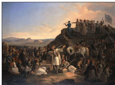
Πίνακας τοῦ Θεόδωρου Βρυζάκη.

Εἶδατε καὶ μὲ τὰ ἴδια σας ὀμμάτια ἐκεῖνο ὅπου ἔπραξα σήμερον πρὶν τοῦ γεύματος ἐναντίον τῶν εἰς βοήθειάν σας ἐρχομένων καὶ εἰς Καματερόν ἐστρατοπεδευμένων ὁμογενῶν σας, τὴν μόνην δηλαδὴ ἐλπίδα τῆς ἐδικῆς σας σωτηρίας. Ἐπειδὴ ἤρρησα νὰ τοὺς κτυπήσω, ἴσως