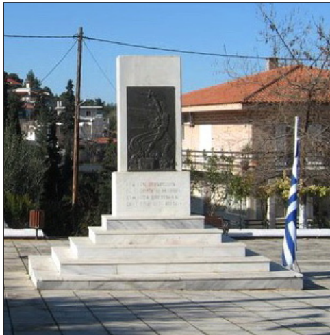
Μνημεῖο στὴν Πλατεῖα τοῦ Μαρτίνου.

(*) Πηγή: Νικόλαος Ἀθ. Μπᾶτσος https://www.martino.gr/efhmerida/62--27/485-maxh-martinou καὶ https://el.wikipedia.org • Ἐπιμέλ. ἡμετ.