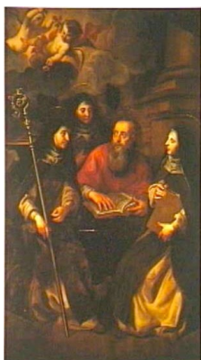
Ὁ Ἅγιος Ἰερώνυμος μὲ τὶς μαθήτριάς του Ἁγίες Μαρκέλλα, Παῦλα καὶ Εὐ- στοχία. Πίνακας τοῦ 15' αἰ.

Ἡ Ἁγία Μαρκέλλα , τὸ πρότυπο τῆς χριστιανῆς χήρας, γεννήθηκε τὸ 330 σὲ μιὰ ἀπὸ τὶς ἐπιφανέστερες οἰκογένειες τῆς Ῥώμης. Νυμφεύθηκε παρὰ τὴν θέλησί της, χήρεψε ἑπτὰ μόλις μῆνες μετὰ τὸν γάμο της καὶ ἀποφάσισε, παρὰ τοὺς πολλοὺς μνηστῆρες ποὺ ἐλκύνονταν ἀπὸ τὴν ὁμορφιά καὶ τὴν εὐγένειά της, νὰ ἀκολουθήσῃ τὸ παράδειγμα τῆς Ἄννης τῆς Προφήτιδος τοῦ Εὐαγγελίου (Λουκ. β') καὶ νὰ ἀφιέρωσῃ τὴν ζωὴ της στὸν Θεό.