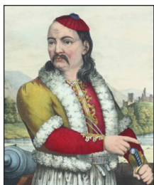
Πετρόμπεης Μαυρομιχάλης. Έργο του Άνταμ ντέ Φρίντελ.

Μετὰ τὸν θάνατο τοῦ πατέρα του, τὸ 1800, κατώρθωσε νὰ συμφιλιώσῃ τὰ μέλη τῆς οἰκογένειάς του, τὰ ὁποῖα χωρίζαν κάποιες ἀντιθέσεις καὶ νὰ ἐπιβληθῆ ὡς μία ἀπὸ τὶς ἰσχυρότερες φυσιογνωμίες τῆς Μάνης.