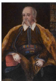
Πετρόμπεης Μαυρομιχάλης. Έργο του Χένρι Τζόν Τζόρτζ Χέρμπερτ.

του Βουλευτικού Σώματος, Πρόεδρος της Β' Εθνοσυνελεύσεως του Άστρους (10-30 Απριλίου 1823), Πρόεδρος του Βουλευτικού και Πρόεδρος του Έκτελεστικού (10 Μαΐου-31 Δεκεμβρίου 1823).