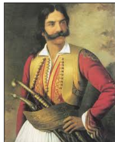
Κυριακούλης Μαυρομιχάλης. (1765-1822)

Μ ε τόν έλιγμό του Όμέρ, οι έλληνικές δυνάμεις πού πολιορκούσαν τά Στύρα εύρέθησαν περικυκλωμένες. Τ ότε, οι περισσότεροι Μανιάτες, βλέποντας τό μάταιο του άγώνα, έγκατέλειψαν τό πεδίο τής μάχης.