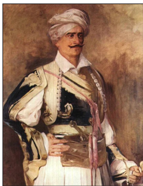
Βάσος Μαυροβουνιώτης. (1765-1822)

ρομιχάλη και πήρε ως λάφυρο τὸ σπαθὶ του. Τὸ κεφάλι του μεταφέρθηκε ἐνώπιον τοῦ Ὁμέρ, ὁ ὁποῖος θαυμάζοντας τὴν γενναιότητα καὶ τὴν ὁμορφιὰ τοῦ γενναίου Μανιάτη ὄπλαρχηγοῦ, εἶπε: «Κρῆμα στὸν ἄνδρα!».