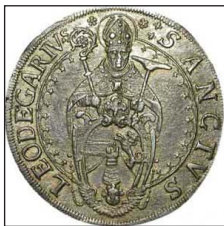
Ἐκτύπωμα τοῦ Ἁγίου σὲ νόμισμα ΙΖ' αἰ.

Ὁ Ἅγιος Λεοδεγάριος (ἢ Λέγερ) ἦταν γόνος ἀρχοντικῆς καὶ ἰσχυρῆς οικογενείας Φράγκων τῆς Βουργουνδίας 1 .