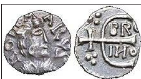
Νόμισμα μὲ τὸ ἐκτύπωμα τοῦ Ἐβροῖν.