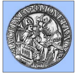
Νόμισμα, τὸ ὁποῖο φέρει σκηνὴ ἀπὸ τὸ Μαρτύριο τοῦ Ἁγίου Λεοδεγαρίου (1518).

Ἀ παθής, ἀκτινοβολώντας τὴν παρρησία ἐκείνη πού δίνει ὁ Θεὸς στοὺς Μάρτυρες, ὁ Ἐπίσκοπος διόλου δὲν διέκοψε τὴν τελετὴ. Π ροχώρησε καὶ στάθηκε μπροστὰ στὸν Βασιλέα, πού φώναζε κουνώντας τὸ σπαθὶ του. Ἐ άφνου, μὲ θεῖα ἐπέμβαση, ὁ Χιλδέριχος ἔχασε τὸ φῶς του, δὲν ἔβλεπε τὸν Ἐπίσκοπο καὶ κατέφυγε στὸ Ἐπισκοπεῖο. Σ τὸ τέλος τῆς τελετῆς, καθὼς ὁ Ἅγιος Λεοδεγάριος δὲν κατόρθωσε νὰ διασκεδάσει τὶς ὑποψίες τοῦ ἡγεμόνα καὶ νὰ τὸν φέρει στὰ λογικά του, ἀποφάσισε νὰ φύγει ὥστε νὰ γλυτώσει τὸν Βασιλέα ἀπὸ τὴν εὐθύνη γιὰ ἓνα ἔγκλημα πού θὰ βάραινε ὅλο τὸ βασίλειο. Μ ὴ μπορώντας νὰ συγκρατήσῃ τὸν δαιμονικὸ του θυμὸ, ὁ Χιλδέριχος ἔστειλε τοὺς στρατιῶτες του νὰ τὸν καταδιώξουν καὶ νὰ τὸν ὀδη-