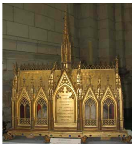
Λειψανοθήκη τῶν Ἁγίων Βινδικτιανοῦ († Μνήμη: 11η Μαρτί- ου) καὶ Λεοδεγαρίου.

Σ τὶς 2 Ὀκτωβρίου 679 (ἢ 680), τέσσερις ἔν- οπλοι τὸν πῆραν καὶ τὸν ὀδήγησαν βαθιὰ μέσα