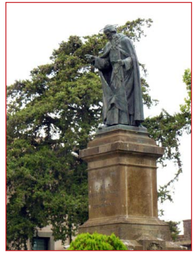
Ἀνδριάντας τοῦ Ὁσίου Νεῖλου, στὴν Μονὴ Κρυπτοφέρρης.

Ἦ στερα ἀπὸ εἰκοσιπέντε χρόνια ἀσκητικῆς ζωῆς στὸ Κοινόβιο τοῦ Ἁγίου Ἀδριανοῦ, ὁ Ὅσιος προγνώρισε ὅτι ὀλόκληρη ἡ Καλαβρία θὰ ἔπεφτε στὰ χέρια τῶν Ἀγαρηνῶν, καὶ περὶ τὸ 980, σὲ ἡλικία ἐβδομήντα ἐτῶν, κατέφυγε στὴν Κάπουα τῆς Καμπανίας, λατινικὴ περιοχὴ. Π ροτίμησε νὰ ζήσει ἄγνωστος σὲ ξένη γῆ, παρὰ νὰ μεταβεῖ στὴν Ἀνατολή, ὅπου ἡ ἐνάρετη φήμη του εἶχε φθάσει ὡς τὰ Ἀνάκτορα τῆς Κωνσταντινουπόλεως.