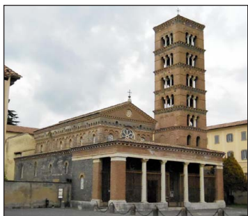
Ἡ Μονὴ τῆς Παναγίας Θεοτόκου τῆς Κρυπτοφέρρης ἢ Μονὴ τοῦ Ὁσίου Νείλου.