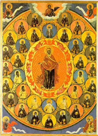
Ἡ Σύναξις τῶν Ἁγίων τοῦ Ἄθω. Φορητὴ Εἰκὼν (17' αι.), Γ. Ν. Πρωτάτου, Ἄθωνος.

Π ληθὺς Ἀθωνιάς, ἀμφὶ θέωκον στήκε Θεοῖο.