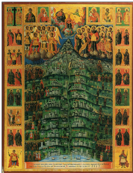
Μονῆς καὶ Ἅγιοι τοῦ Ἁθῶ. Φορητὴ ἱ. Εἰκὼν Ρουμανικῆς Σκίτης. Ἔργο Γενναδίου Μοναχοῦ τοῦ Ρώσου, 1859.

ρίαν ἐδοκίμαζον οἱ Μοναχοί, ὥστε μόλις εἶχον τὸν ἐπιούσιον ἄρτον. Ἐν μιᾷ δὲ τῶν ἡμερῶν ἐπῆγεν εἰς ἱεροπρεπῆς καὶ σεβάσμιος γέρων εἰς τὸν θυρωρόν, καὶ τὸν παρεκάλεσε νὰ τὸν δεχθῆ μέσα εἰς τὸ Μοναστήριον. Ὁ δὲ θυρωρὸς τὸν ἐδέχθη, ἀλλὰ κρυφίως. Ἐπειτα ἐνῶ ἐφιλοξένει αὐτόν, τοῦ λέγει· «Μὴ θαυμάσης, καλὲ ἄνθρωπε, ὅτι δὲν σὲ περιποιοῦμαι καθὼς πρέπει. Διότι ἄλλοτε τὸ Μοναστήριον τοῦτο ἦτο τόσο εὐτυχισμένον, ὥστε καὶ αὐτὸς ὁ Ἐπίσκοπος ἐὰν ἤρχετο, τὸν περιποιοῦντο πλουσιοπάροχα. Ἀλλὰ τόσο τούτο ἐδυστύχησεν, ὥστε οὐδὲ τὸν πτωχότερον