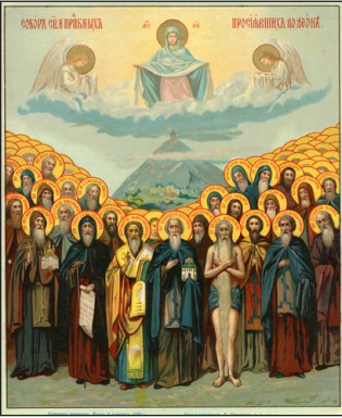
Ἡ Σύναξις τῶν Ἁγίων τοῦ Ἁθῶ. Ρωσικὴ χρωμολιθογραφία, 1896.

οὗτοι παρεκίνησαν καὶ τοὺς βασιλεῖς νὰ ἐξοδεύσωσι μεγαλοπρεπῶς εἰς τὴν τούτων οἰκοδομὴν· τοὺς Κωνσταντίνους, λέγω, καὶ τοὺς Νικηφόρους· τοὺς Ρωμανούς· τοὺς Ἀλεξίους· τοὺς Καντακουζηνούς· τοὺς Παλαιολόγους· τὰς Πουλχερίας καὶ τοὺς λοιπούς.