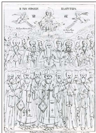
Ἡ Συναξίς τῶν Ἁγίων τοῦ Ἁθῶ. Λιθογραφία τῆς Α' ἐκδ. τῆς Ἀκολουθίας τῶν Ἁγίων τοῦ Ἁθῶ. Ἑρμούπολη, 1847. Ἔργο Γεωργίου Μαργαρίτη.

Ἐκ μέρους τοῦ ἐργαζομένου, διότι οἱ θεῖοι οὗτοι Πατέρες, οἱ ὅποιοι τὰ ἔκτισαν, παρεκτὸς ὅτι πολλοὶ ἐξ αὐτῶν ἦσαν μεγαλοπρεπεῖς ἄνθρωποι, καὶ βασιλεῖς καὶ βασιλέων υἱοί, καὶ συγκλητικοὶ καὶ βασιλέων ὑπογραφεῖς, ὡς ὁ Συμεὼν καὶ ὁ Σάββας, οἱ κτίτορες τῆς τοῦ Χιλανταρίου καὶ Βατοπαιδίου Μονῆς· Παῦλος ὁ κτίτωρ τῆς Μονῆς τοῦ Ξηροποτάμου καὶ τοῦ Ἁγίου Γεωργίου· Ἰωάννης καὶ Εὐθύμιος οἱ τῆς τῶν Ἰβήρων· καὶ Νεόφυτος ὁ τῆς τοῦ Δοχειαρίου. Πρὸς τούτοις αὐτοὶ