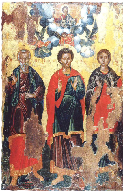
Οἱ Ἅγιοι Φανέντες. Δεσποτική εἰκόνα τοῦ τέμπλου τῆς ὁμώνυμης Μονῆς, ἔργο τοῦ 1654.