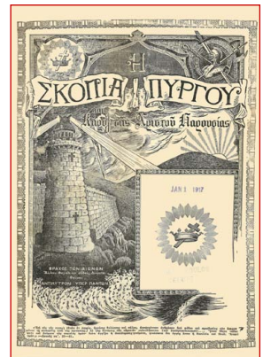
Τὸ τεῦχος τῆς 1ης Ἰανουαρίου 1917 τῆς «Σκοπιᾶς».