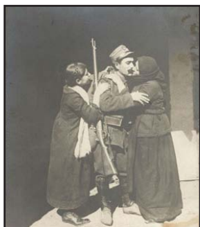
Ἑλληνας στρατιώτης τῶν Βαλκανικῶν Ἀγῶνων στὴν ἀγκαλιά συγγενῶν του, καθὼς ἐπιστρέφει νικητής (Ἐπιστολικὸ δελτάριο. Διαστ. 90x139 χιλ.)