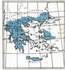
Η ΕΛΛΑΣ ΤΟΥ 1920

Γερμανός Καραβαγγέλης υπήρξαν οι κήρυκες τῆς ιδέας τοῦ ἐνό- πλου ἀγῶνος.