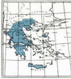
Η ΕΛΛΑΣ ΤΟΥ 1913