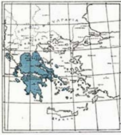
Η ΕΛΛΑΣ ΜΕΧΡΙ ΤΟΥ 1912