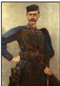
Παῦλος Μελάς, (1870-1904)

Συγκεκριμένως, τὴν 28ῃ Ἰουλίου 1913 (10ῃ Αὐγούστου νέου ἡμ.), ὑπεγράφη ἡ Συνθήκη Εἰρήνης τοῦ Βουκουρεστίου, μετὰ τὴν ὁποία ἐτερματίζετο ὁ Β' Βαλκανικὸς Πόλεμος καὶ ἡ Ἑλλὰς