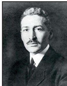
Ἴων Δραγούμης, (1878-1920)