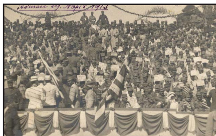
Στιγμὲς ἀπὸ τὰ ἐπινίκια τῶν Βαλκανικῶν πολέμων: Ἑλληνικὲς σημαῖες καὶ γελαστὰ πρόσωπα στρατιωτῶν. (Ἐπιστολικὸ δελτάριο. Διαστ. 139x88 χιλ.)

Ἦθεν, χρέος ὅλων ἡμῶν, εἶναι νὰ τὸ εορτάζουμε μεγαλοπρεπῶς καὶ νὰ προσπίπτουμε εὐλαβικῶς στους ἱεροὺς τάφους ὅλων ἐκείνων τῶν συμπατριωτῶν μας ποὺ βρῆκαν μαρτυρικὸ θάνατο ἀπὸ τὸν Τοῦρκο κατακτητὴ καὶ ἀπὸ τὸν Βούλγαρο κομμитаτζῆ, δίδοντες πρὸς αὐτοὺς τὴν ὑπόσχεσι, ὅτι ἐμπνεόμενοι καὶ καθοδηγούμενοι ἀπὸ τὴν θυ-