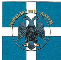
‘Η σημαία τής Μακεδονίας κατὰ τὸν Μακεδονικὸ Ἀγῶνα.

‘Η Μακεδονία, πὸ εἶναι ἀπὸ τὴν Ἀρχαιότητα ή πλέον αἰματοβαμμένη περιοχή τής Ελλάδος, καὶ στὴν ὁποῖαν, ἐκτὸς τῶν ἄλλων, ἔλαβαν χώραν ὁ Μακεδονικὸς Ἀγῶνας, οἱ Βαλκανικοὶ Πόλεμοι καὶ οἱ δύο Παγκόσμιοι Πόλεμοι, εἶναι ἀνεκαθεν ὁ προμαχὼν τοῦ Ἑλληνισμοῦ καὶ τὸ βᾶθρο τής Ἑλληνικῆς καὶ τής Παγκόσμιας Ἱστορίας καὶ τοῦ Πολιτισμοῦ. Εἶναι κυριολεκτικῶς τὸ προπύργιο καὶ ή ἐθνικὴ ἔπαλξις τής Ελλάδος.