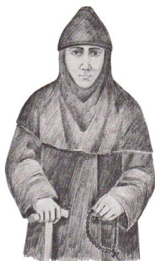
Ἡ Ὁσία Ἀναστασία τοῦ Παντᾶν (1819-1901).