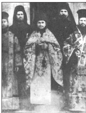
Ὁ Ἅγιος Γλυκέριος εἰς τὸ μέσον, ὡς Ἱερομόναχος, μετὰ τὸν Συνασκητὴν αὐτοῦ Ἱεροδιάκονον Δαβίδ καὶ ἄλλους Πατέρας.

τῶν. Ὁ ζηλωτὴς Ἱερομόναχος, κατανοῶν τὴν ἀνάγκην τῶν περιστάσεων, ὑπεχώρησε καὶ ἐδέχθη τὴν παράκλησιν.