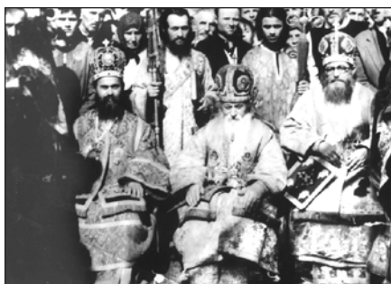
Ὁ Ἅγιος Γλυκερίος εἰς Συλλείτουργον μετὰ τοὺς Ἐπισκόπους Εὐλόγιον καὶ Μεθόδιον.

Μετὰ τὸ πέρας τοῦ Πολέμου, ὁ εὐλογημένος Ἱερομόναχος Γλυκερίος ἤρχισε πάλιν τὰς ποιμαντικὰς αὐτοῦ δραστηριότητας καὶ ἀνέλαβε τὸ βαρύτερον ἔργον τῆς ἐπανοικοδομήσεως τῶν κατηδαφισμένων Ναῶν καὶ τῶν κατερειπωμένων Μονῶν, καθὼς ἅπαντα ἦσαν κατεστραμμένα κατὰ τὸν διωγμὸν τοῦ ἔτους 1936.