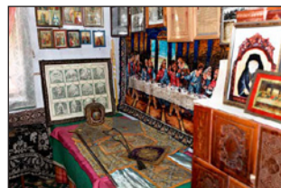
Τὸ μικρὸν κελλίον τοῦ Ἁγίου Γλυκερίου.

Ἐκτοτε, διέμενεν ἐν τῇ μεγάλῃ ἀνδρική Μονῇ τῆς Μεταμορφώσεως εἰς Σλατιοάραν, ἐξ ἧς δέκα περίπου μόνον φορὰς ἐξῆλθε πρὸς Ἐγκαινισμὸν Ἱερώων Ναῶν.