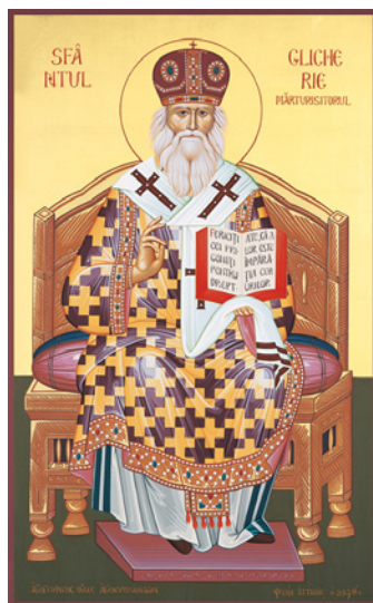
Ἱερὰ Εἰκὼν ἐκ τοῦ Ἁγιογραφείου τῆς Ἱ. Μ. τῶν Ἁγίων Κυπριανοῦ καὶ Ἰουστίνης, Φυλὴ Ἄττικῆς, 1999.

Τῷ δὲ ἐν Τριάδι Παναγίῳ Θεῷ, τῷ ἐνδοξαζομένῳ ἐν τοῖς Ἁγίοις Αὐτοῦ, προσκύνησις καὶ εὐχαριστία, εἰς τοὺς αἰῶνας τῶν αἰῶνων. Ἀμήν!