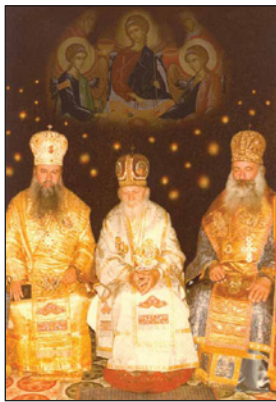
Ὁ Ἅγιος Γλυκέριος, εἰς τὸ μέσον, μετὰ τοὺς μακαριστοὺς Μητροπολίτας Σιλβεστρον καὶ Κυπριανόν.

Ο ἱ λόγοι αὐτοῦ ἦσαν ὀλίγοι, ἀλλὰ σοφοὶ καὶ γλυκεῖς. Ἦ δίαίτα αὐτοῦ λιτωτάτη. Τ ὸ πρόσωπόν αὐτοῦ ἔλαμπεν, ὥστε οὐδεὶς ἠδύνατο ἀτενίζειν εἰς αὐτό.