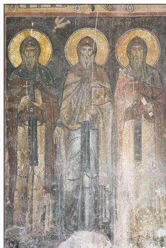
Οἱ Ὅσιοι Σίω Μγβίμε, Ἰωάννης Ζενταζέني καὶ Εὐάγριος.

Τὸ Θαῦμα αὐτὸ ἐπανελαμβάνετο κάθε χρόνο μέχρι τῆς βασιλείας τοῦ Σάχη τῶν Περσῶν Ναδῆρ (1736-1747), ὁ ὁποῖος διαπιστώσας τὴν γνησιότητα τοῦ Θαύματος, κατέστρεψε τὴν Ἱερὰ Μονὴ καὶ τὸν τάφον τοῦ Ὁσίου.