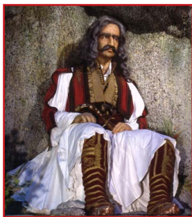
Κέρινο ὁμῖωμα. Μουσεῖο Ἑλληνικῆς Ἱστορίας.

Ὅ μως πάντα ἦταν πραγματικὰ ἀνεξίκακος. Κ άποτε πολλὰ χρόνια πρίν, τὸν εἶχε πλησιάσει αὐτὸς πού εἶχε σκοτώσει τὸν ἀδελφό του ἐκτελώντας ἐντολὴ τῶν Τούρκων. Π ίστευε ἴσως ὅτι ὁ Γέρος τοῦ Μοριᾶ δὲν θὰ τὸν ἀναγνώριζε. Ἦ ταν μάλιστα τόσο τὸ θράσος του πού φορώντας τὸν ὀλόχρυσο ντουλαμὰ τοῦ θύματος, τόλμησε νὰ τοῦ ζητήσῃ καὶ μιὰ χάρη. Ὁ Κολοκοτρώνης ἀναστέναξε βαθιὰ. Ἄ λλος θὰ ὄρμαγε πάνω του νὰ τὸν σκοτώσει. Αὐ τὸς ὅμως ἔκανε τὸ ἀντίθετο. Τ ὸν δέχθηκε μὲ τὴν καλοσύνη καὶ τὴν ταπεινότητα πού τοῦ ὑπαγόρευε τὸ μεγαλεῖο τῆς γενναίας φυγῆς του. Δ ὲν τὸν ἐξυπηρέτησε μόνο, ἀλλὰ τὸν κράτησε φιλόξενα καὶ γιὰ βραδινὸ φαγητό.