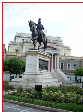
Ὁ ἔφιππος ἀνδριάντας μπροστὰ στὴν Παλαιὰ Βουλὴ.

Στὸ ἴδιο τραπέζι ἔκατσε καὶ ἡ μάνα του. Μό - λις ἀναγνώρισε τὸν χρυσοκέντητο ἐπενδύτη τοῦ δολοφονημένου παιδιοῦ της, ξέσπασε σὲ κλάμα- τα. Μέ σα στὴν δικαίαν της ἀγανάκτηση τὰ ἔβαλε μὲ τὸν Στρατηγὸ. « Π ῶς βάζεις στὸ τραπέζι μας τὸν φονιὰ τοῦ ἀδελφοῦ σου;»,... τοῦ εἶπε μέσα ἀπὸ τὰ ἀναφιλητά της. Ἀ μέσως ὅμως πῆρε μιὰ ἀληθινὰ Χριστιανικὴ ἀπάντηση ἀπὸ τὸ στόμα τοῦ μεγαλόφυχου γιοῦ της: « Σ ώπασε μάνα, ἐγὼ τὸν συγχώρεσα καὶ αὐτὸ τὸ τραπέζωμα εἶναι τὸ καλύτερο μνημόσυνο γιὰ τὸν μακαρίτη τὸν ἀδελφὸ μου!»,... καὶ μὴ μπορώντας νὰ κρα- τηθεῖ ἄλλο πιά, ξέσπασε καὶ ἐκεῖνος σὲ κλάματα.