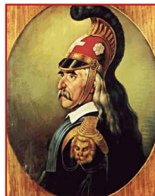
Ἐλαιογραφία σὲ μουσαμά. Διονύσιος Τσόκος (1861).

Πέρασε ἀπὸ τὴν Τριπολιτσὰ καὶ σταμάτησε εὐλαβικὰ κἀνοντας τὸν σταυρό του μπροστὰ ἀπὸ τὸ ξερὸ