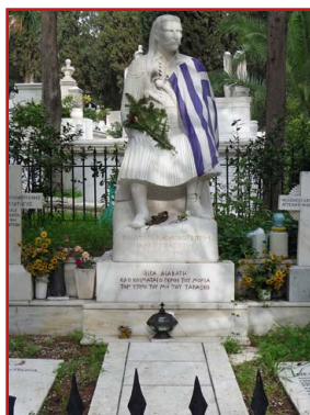
Τὸ ταφικὸ Μνημεῖο στοῦ Α' Νεκροταφεῖο Ἀθηνῶν.

κρυσμένα μάτια καὶ μὲ τρεμουλιασμένη φωνὴ ξεκίνησε νὰ πεῖ τὰ τελευταῖα λόγια: « Ἕλληνες! Ἄνὴρ μέγας ἐτελεύτησε...». Δὲν μπόρεσε ὅμως νὰ συνεχίσει γιὰ πολὺ καὶ ὁ λαλίστατος λογοτέχνης κλαίγοντας ἀναγ-κάσθηκε νὰ ὁμολογήσει: «... τὸ κυριεύσαν τὴν ψυχὴν μου πένθος παραλύει τὴν λαλιάν μου». Ἔ τσι ὁ τελευταῖος ἀποχαιρετισμὸς δὲν ὀλοκληρώθηκε.