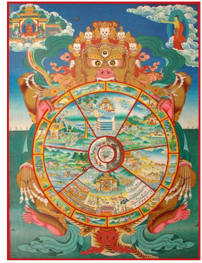
Παραδοσιακὸ θιβετιανὸ thanka πού δείχνει τὸ bhavacakra καὶ τὴν σφαίρα τῆς Σαμαάρα.

Τ ελικὰ ὅμως τὸ ἰσχυρότερο «ὄπλο» πού ἔχει στὴ διάθεσή του ὁ ἄνθρωπος εἶναι ἡ μετενσάρκωση ἢ μετεμψύχωση.