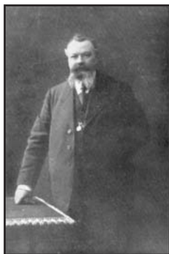
Ζεράρ-Άνακλέ-Βεν- σάν Άνκώς (Papus). (1865-1916)

ἀόριστης ύφης «πνευματικὰ» «παρακολου- θοῦντα ὄντα». «Τὸ ζωντανὸ ὄν ἀποκτᾶ ἓνα σῶμα (πεδίο δράσεως) γιὰ νὰ ἐκτίσει τὴ φυ- λάκισή του ἀνάλογα μὲ τὶς ἀστρολογικὲς ἐπι- δράσεις. Ἔτσι τὸ πεπρωμένο τοῦ ἀνθρώπου καθορίζεται ἀπὸ τὴ θέση τῶν ἄστρον κατὰ τὴ γέννησή του».