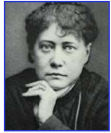
Ἑλενα Πετρόβνα Μπλαβάτσκυ. (1831-1891)

Τ ὸ πῶς καὶ πότε θὰ πραγματοποιοῦνται οἱ μετενσαρκώσεις αὐτὲς ἐξαρτᾶται, κατὰ θεωρητικούς τῆς δοξασίας, ἀπὸ τὰ ἄστρα (ἀστρολογία) καὶ καθορίζεται ἀπὸ τὴν «Λευκὴ Ἠγεσία» ἢ ἀπὸ